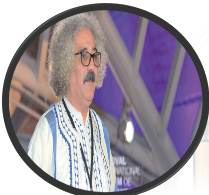
Acteur marocain Ohamed CHOUBI