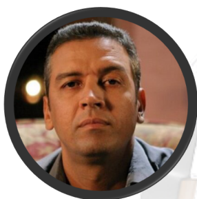
Aziz Houbaibi Acteur marocain