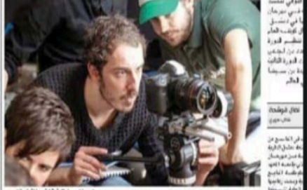
تصوير سينمائي خلية جوشن في التجريب

وعشرون دولة تشارك في مهرجان سوريا للأفلام الطلابية