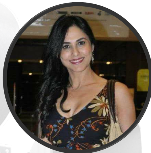
Actrice marocaine Zoubida AKIF