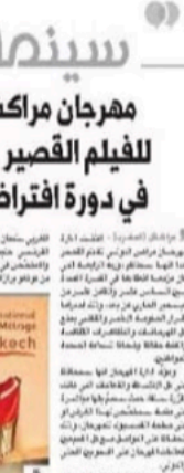
تصوير سينمائي خلية جوشن في التجريب

وتعاير إلى مع العروض المستعملة في نفس المهرجان وإسبقت مني في مجال كلمات خاصة استعابوا والممثل الفرنسي والمونتاج