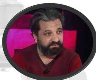
Imed ELOUSLATI Réalisateur Tunisien