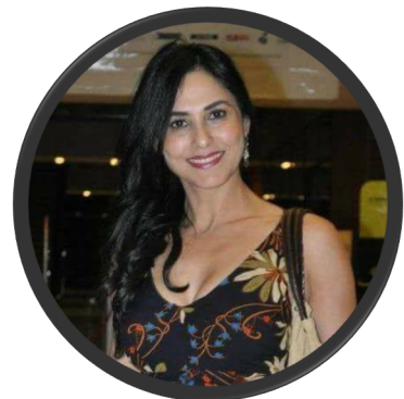
Actrice marocaine Zoubida AKIF