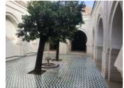
Mosquée Sidi Abdelaziz