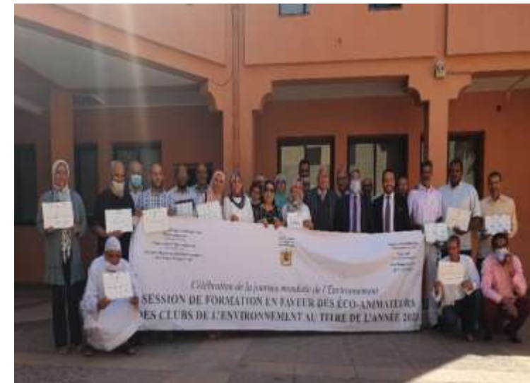
Session de formation des éco-animateurs