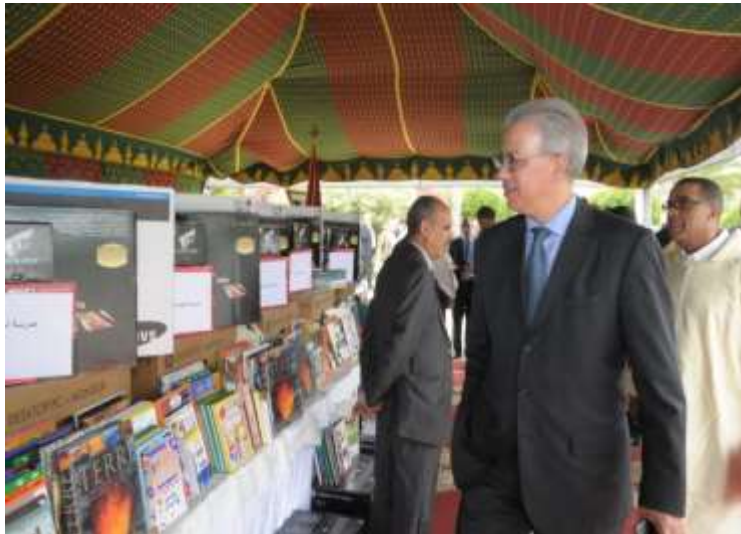
1 ère Cérémonie distribution des équipements informatiques et audiovisuels, le 14 Juin 2019