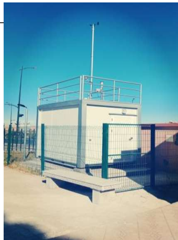
Station Complexe sportif Bab Khmis