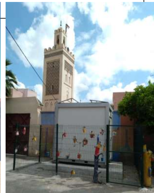
Station école Ahmed Ennour