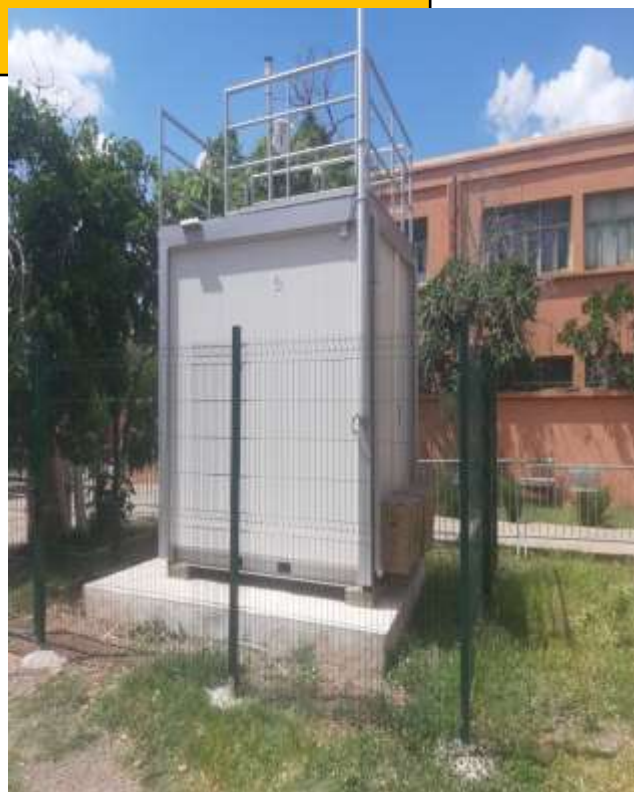
Station Centre Régional des métiers de l'éducation et de la formation