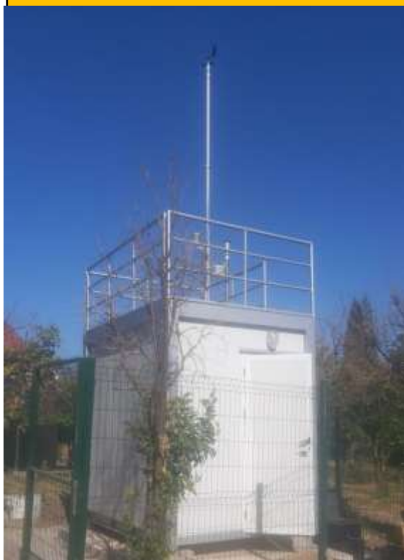
Station Lalla Aouda Saâdia