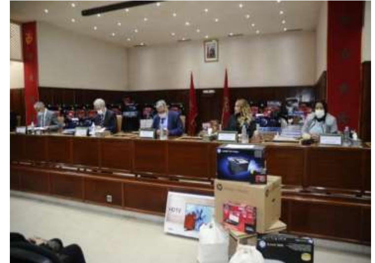
2 ème Cérémonie distribution des équipements informatiques et audiovisuels, le 06 Avril 2021